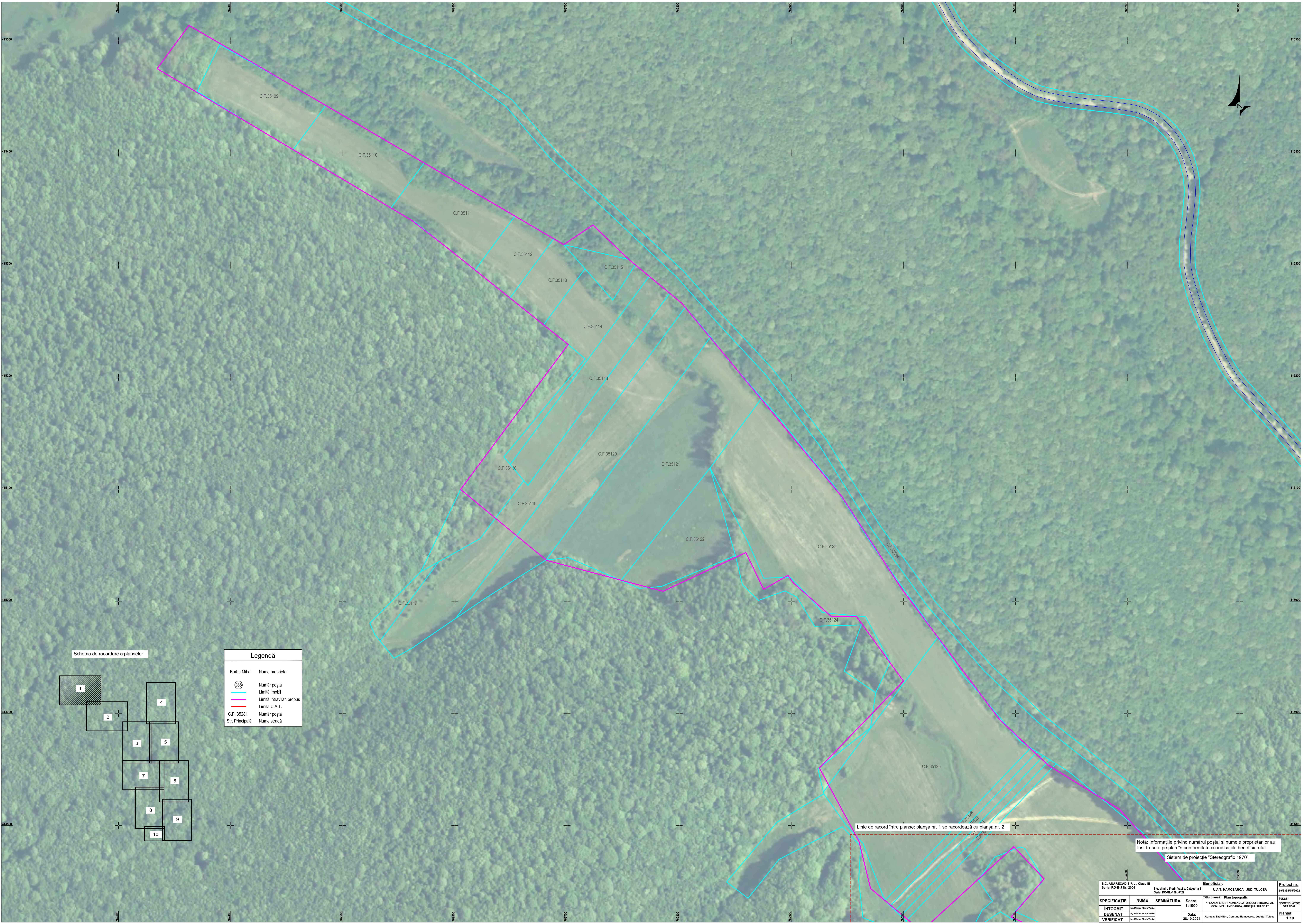
Schema de racordare a planșelor